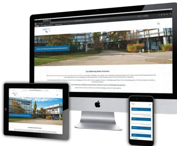
Beispiel: die Kaufmännische Schule Göppingen

Im Kern ist die Anmeldeplattform „SUS iForms“ eine Website mit einem integrierten, sicheren Web-Formulargenerator. Die Schülerdaten können per CSV-Datei exportiert und über die Importschnittstelle des Schulverwaltungsprogramms importiert werden.